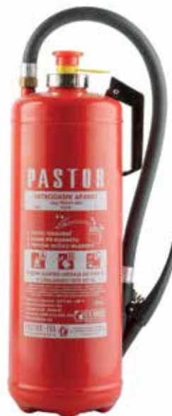
Ručni aparat za gašenje prahom

Ručni aparat za gašenje ugljen-dioksidom (CO 2 ) je prvenstveno namijenjen za gašenje požara na električnim instalacijama napona do 10.000 V, a može se upotrebljavati i za gašenje požara klase „B“ i „C“.