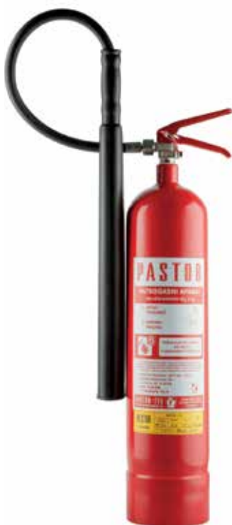
Ručni aparat za gašenje ugljen-dioksidom (CO 2 )