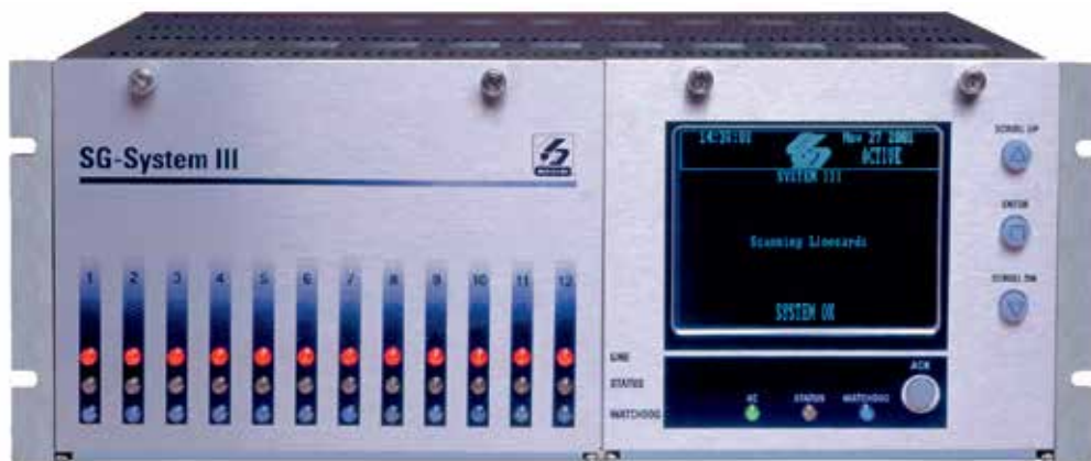
SG System III

Zašto su navedene funkcije i postavke u današnje vrijeme korisne? Komercijalizacija interneta i tržišno natjecanje pružatelja telekomunikacijskih usluga doveli su do sve veće upotrebe IP i GSM telefonskih linija. Čak i kada korisnik ima klasičnu telefonsku liniju, to još uvijek ne znači da se cijelim putem od alarmne centrale do alarmnog centra prijenos alarmnog događaja vrši klasičnim putem.