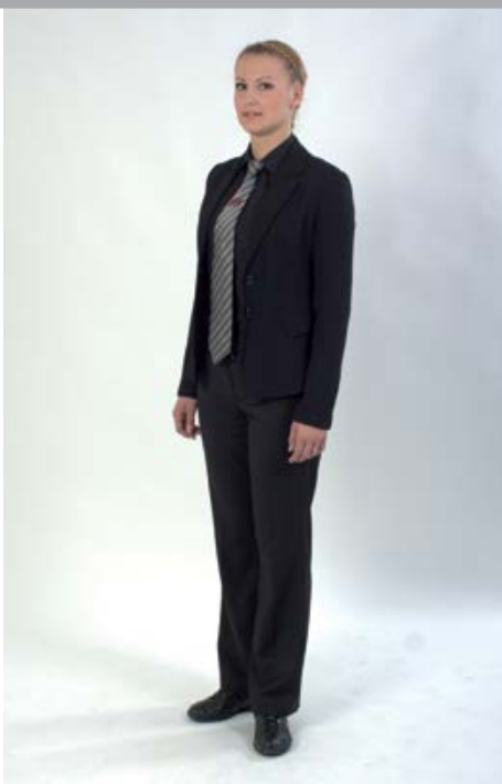
Uniforma - odijelo