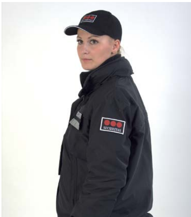
Uniforma - odijelo

Ostala oprema u skladu sa radnim mjestom i zadacima.