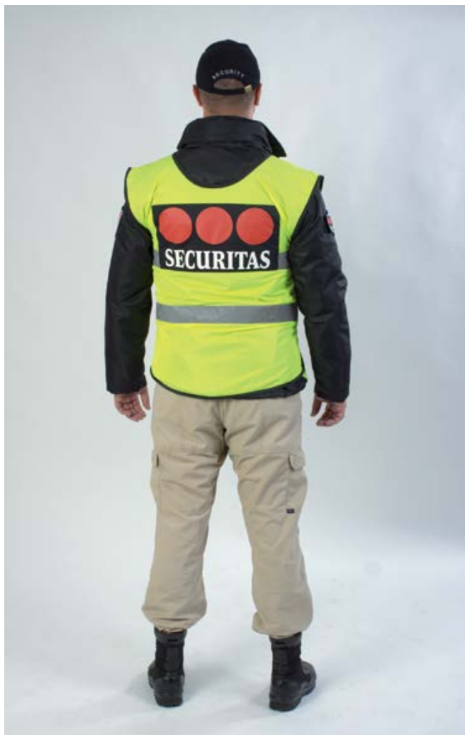
Dopunski dijelovi uniforme