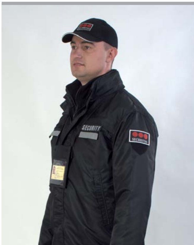
Uniforma - odijelo